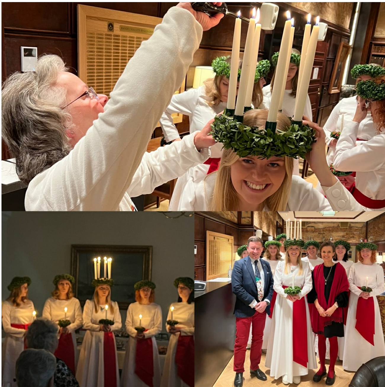
Bildcollage från förra årets jullunch

Anmälan till årets jullunch i Festsalen torsdagen den 14 december kl. 12-15 är nu öppen!