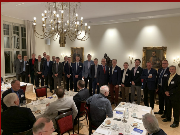
Bild från introduktionsaftonen för nya medlemmar som efter en lång