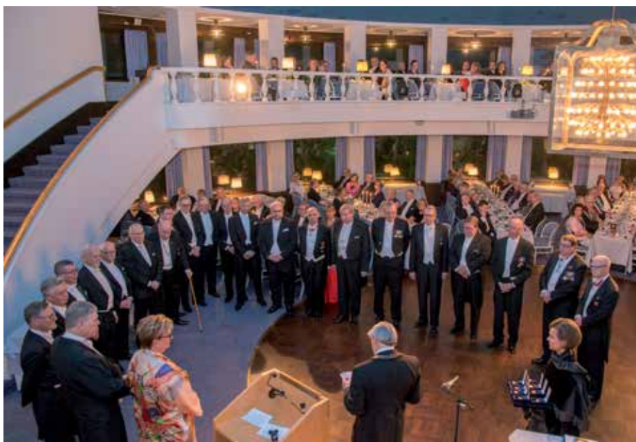
I samband med jubileet delade Gillet ut 33 utmärkelser och förtjänsttecken.

Jens Berg Ekonomiska Samfundet i Finland r.f. Svenska handelshögskolan