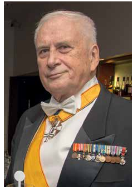
General Gustav Hägglund höll festföredraget.