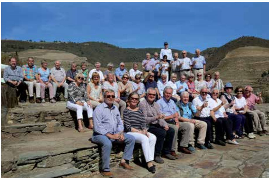
Vinklubbens resa till Portugal samlade 40 glada deltagare.

I Ferrão möttes vi av en gammal Bedford lastbil från 1950-talet. Längs sling-