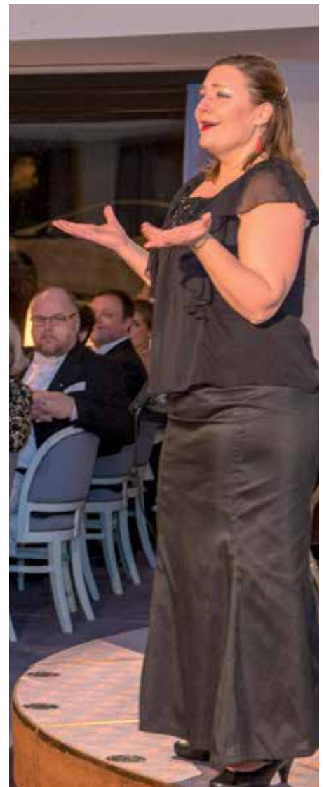
Mezzosopranen Flavia di Nola-Vatanen.