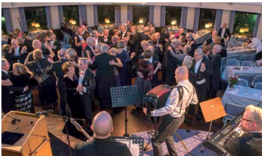
Festen avslutades med dans till tonerna av Henrik Wikströms orkester.