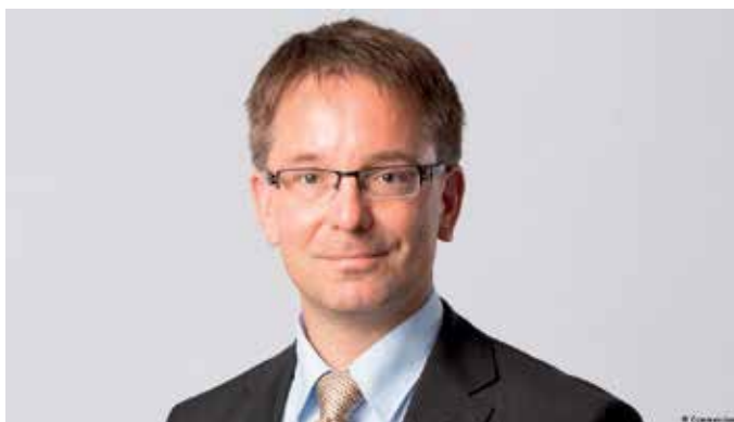
Enligt tyska Commerzbanks makroekonom Bernd Weidensteiner avgörs eurons öde i Italien.

Den oberoende forskningsinstitutionen Fund for Peace publice-