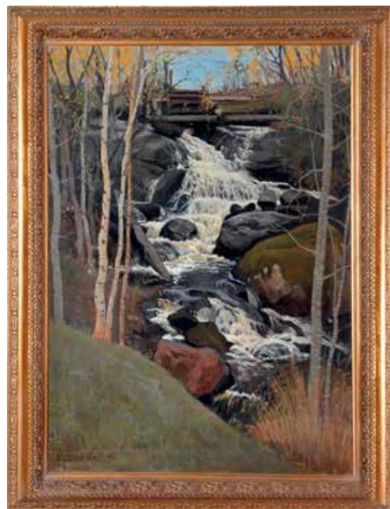
Den porlande bäcken målade Väinö Blomstedt under sina bästa år.

Väinö Blomstedt deltog i världsutställningen i Paris år 1900 med tre målningar (bland annat med en målning av Olofsborg) och mottog en bronsmedalj.