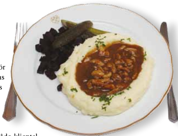
Hederlig fläsksås kan man äta till exempel på Kolme Kruunua.

Till skillnad från de typiska kvarterskrogarna som utvecklats från ölkrogar till