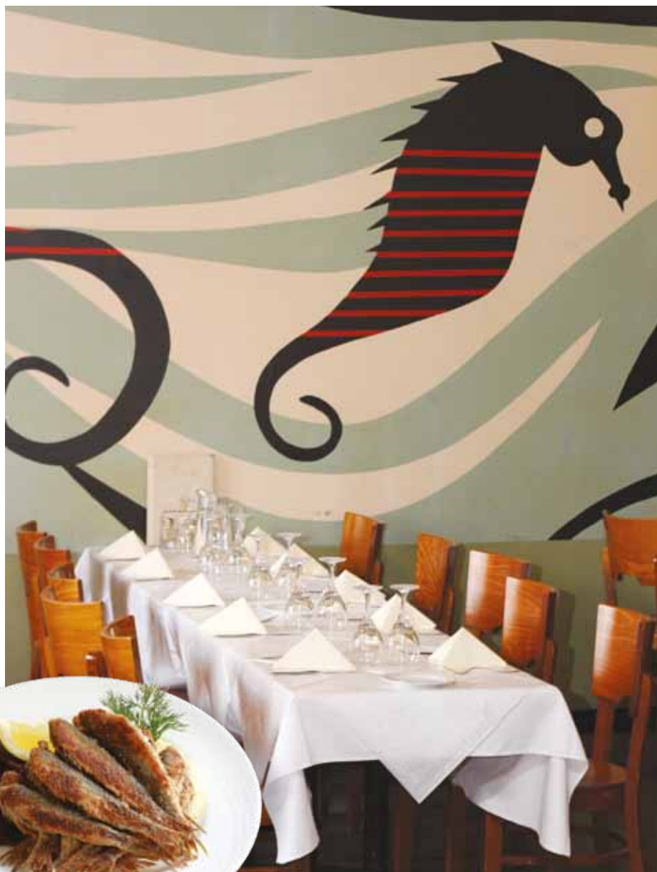
Interiören på Sea Horse är återställd till 30-talsskick.

Sea Horse, eller i folkmun Sikala, har funnits på Kaptensgatan 11 sedan år 1934. Restaurangen började som en matkrog för närkvarterens invånare och arbetare. Krigstiden var svår och det var ont om mat, men restaurangen överlevde. År 1959 fick Sea Horse nya ägare och stekt strömming infördes på menyn. Restaurangen blev känd som en plats där konstnärer, filosofer och andra kändisar träffades. Då