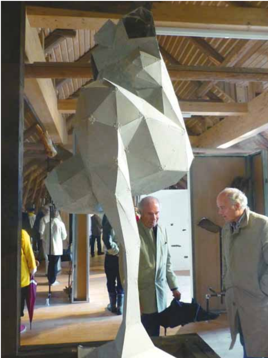
En del konstverk har köpts av museer. The Alienation of Objects 2009–12 av britten Toby Ziegler är från Kiasma. Ziegler grundar sin idé på Greklands klassiska skulpturer, som han grovt förenklat. Materialet är aluminium.

taurang Kapellet i Lovisa, där en riklig och delikat lunch avnjöts i sen 1800-talsmiljö, och till skärgårdsmuseet i Rönnsås.