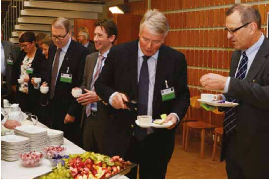
Diskussionen var livlig också i Hankens foajé under kaffepausen och efter seminariet.