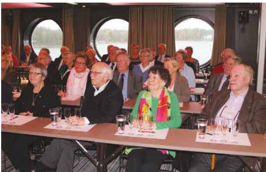
I väntan på champagneprovningen.

förväg så att vi skulle få en möjligast väl anpassad kombination. Av kommentarerna att döma lyckades detta, mycket tack vare fartygets fina vinlista. Vinerna fick överlag ett goda betyg.