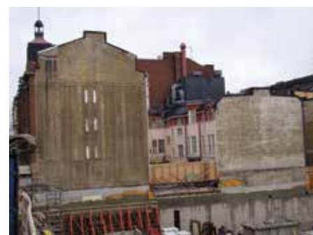
Den här gaveln såg Gillemedlemmarna senast på 1960-talet.

Så här ska grannhuset se ut då det står klart nästa år.