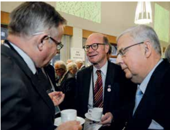
Före riksdagsledamoten, kommunikationsrådgivaren, Kimmo Sasi hörde till seminariedeltagarna.