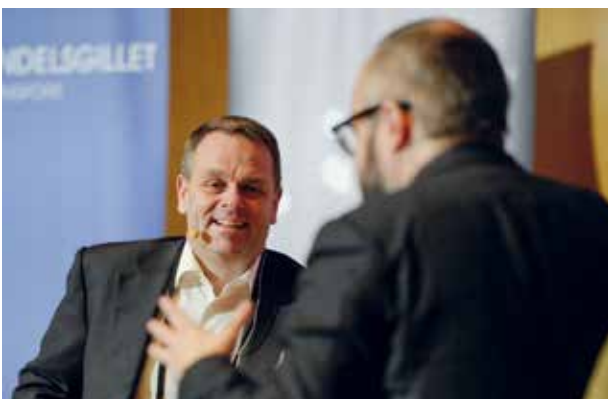
Helsingfors borgmästare Jan Vapaavuori gav sin syn på stadens utveckling.