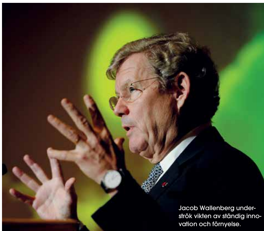
Jacob Wallenberg underströk vikten av ständig innovation och förnyelse.