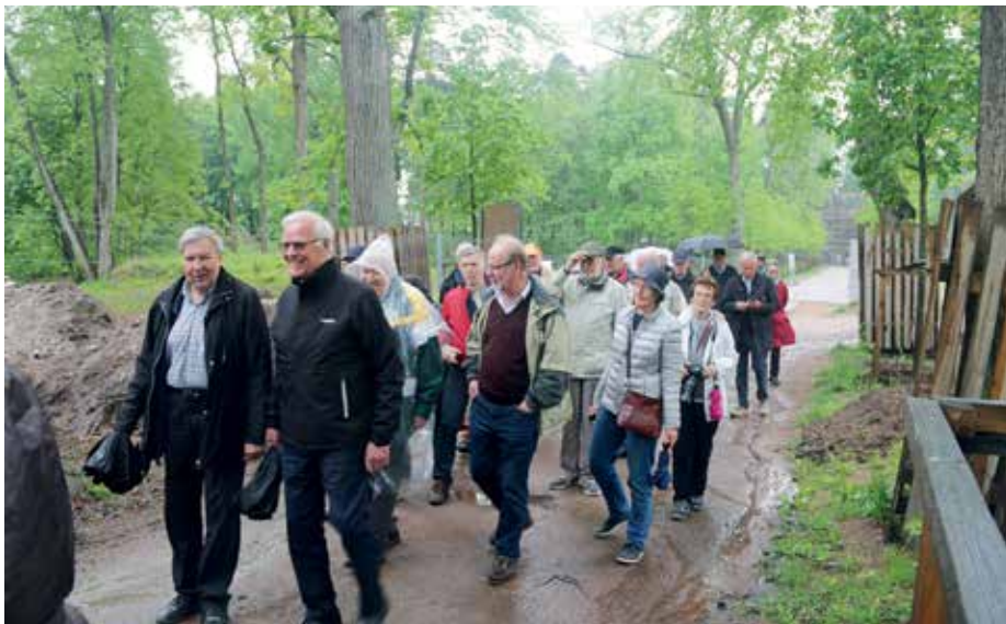
Gruppen i Monrepos-parken.