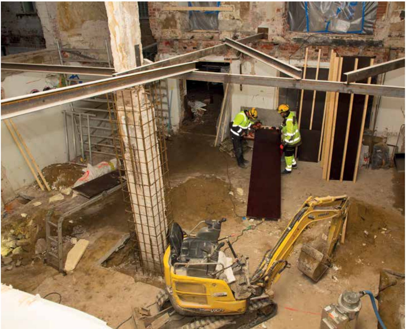
Om ett halvt år spelas här biljard. Salen får också en egen ingång från bakgården.

Om alla löften infrias går klubblokalteterna mot en ljus framtid.