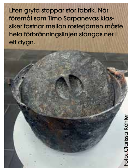
Liten gryta stoppar stor fabrik. När föremål som Timo Sarpanevas klassiker fastnar mellan rosterjärnen måste hela förbränningslinjen stängas ner i ett dygn.