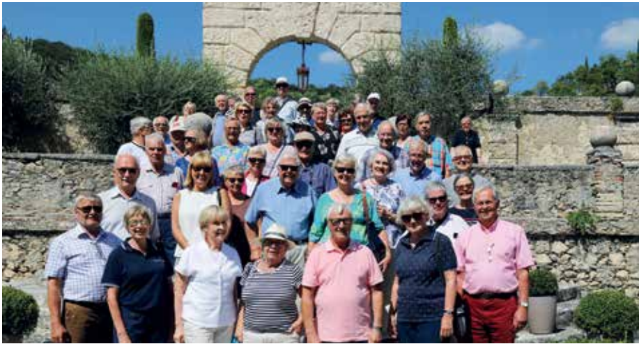
På Vinklubbens resa hann deltagarna också med lite kultur.