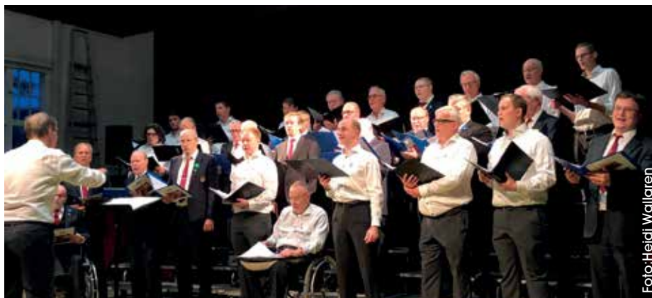
Frihetsbröderna gav en höstkonsert tillsammans med Sibbo Sångarbröder.