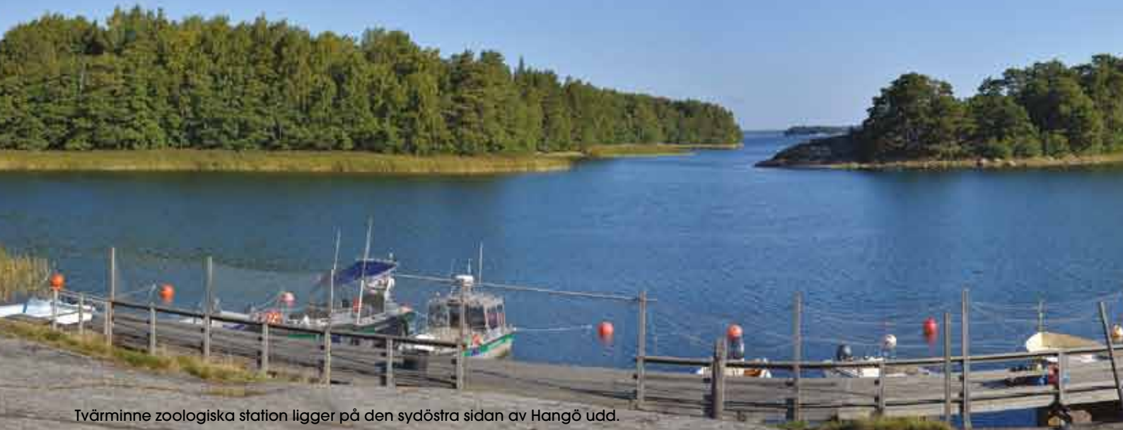
Tvärminne zoologiska station ligger på den sydöstra sidan av Hangö udd.