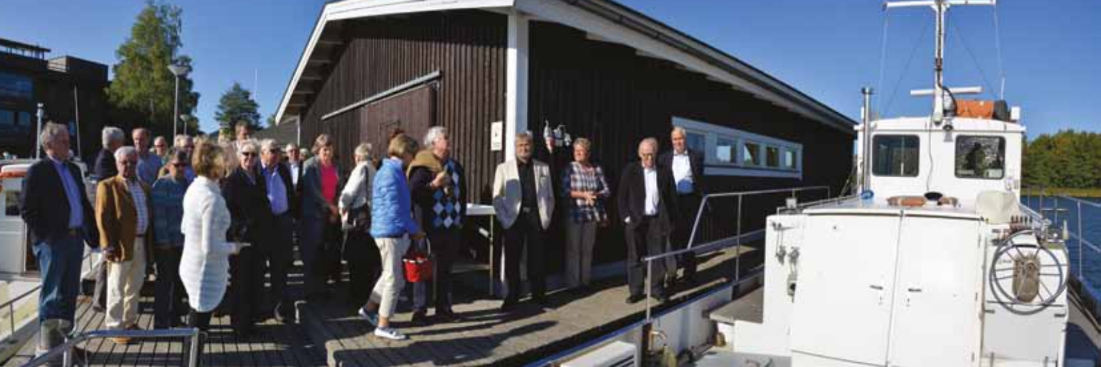
Forskningsfartyget Saduria intresserade besökarna.

fyllda med containrar och lager, visar att andra gjort det.