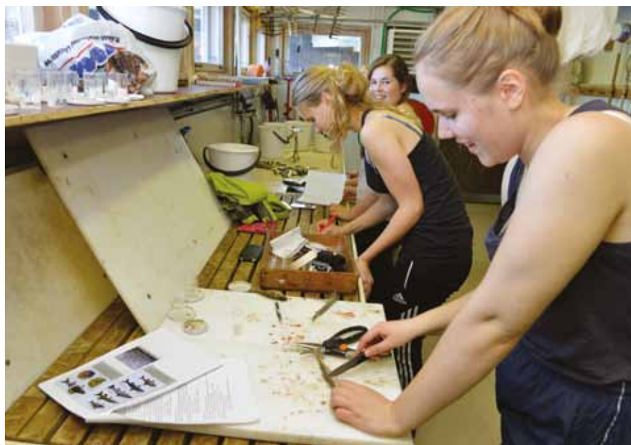
På Tvärminne zoologiska station undersöker man bland annat havsbottens flora och fauna.

– Hangö har inga stora markområden, 117,46 kvadratkilometer är inte särskilt mycket. Dessutom ligger Hangö på en udde, men vi har 130 kilometer strandlinje. Av dem är 30 kilometer sandsträn-