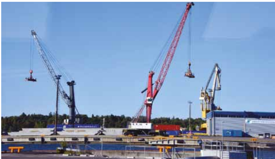
Hamnen är ett av de tre ben som Hangös ekonomi vilar på.

När vi närmar oss staden kör vi förbi byggnader och anläggningar som i tiderna byggt upp Hangö-imaget. Hangö Kex, står det tydligt på en byggnad och resenärer med hangöbakgrund kan berätta att anrika företag som Valio, Helkama och Hyvon startade sin verksamhet här. Vi kör förbi stora asfalterade områden som låter oss förstå att alla satsningar inte utvecklats som man tänkt sig. Men stora områden,